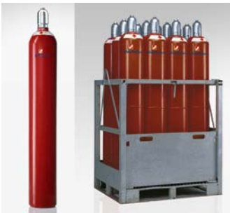
Abb. 1 50-l Acetylenflaschen, links einzeln, rechts 12 Flaschen palettiert