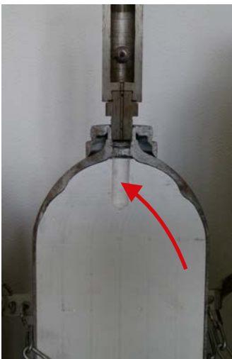
Abb. 3 Querschnitt durch eine Acetylenflasche mit porösem Material im Behälter (weiß) und dem freien Volumen am Flaschenanschluss (roter Pfeil)