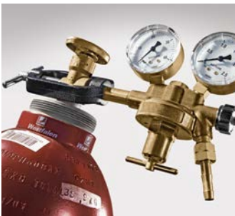
Abb. 2 Charakteristischer Flaschendruckminderer mit Überwurfbügel